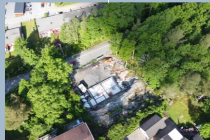
Byggstartade bostäder i Floda del 2