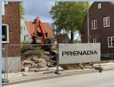
Havsnära parhus i Helsingborg del 2