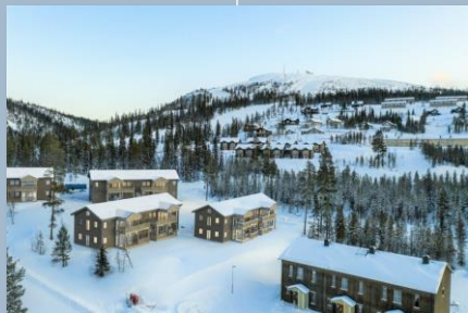
Försålda ski-in stugor i Vemdalen